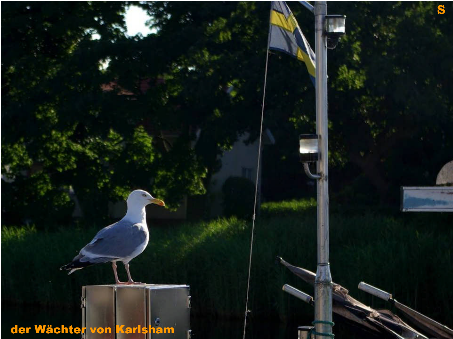
der Wächter von Karlsham