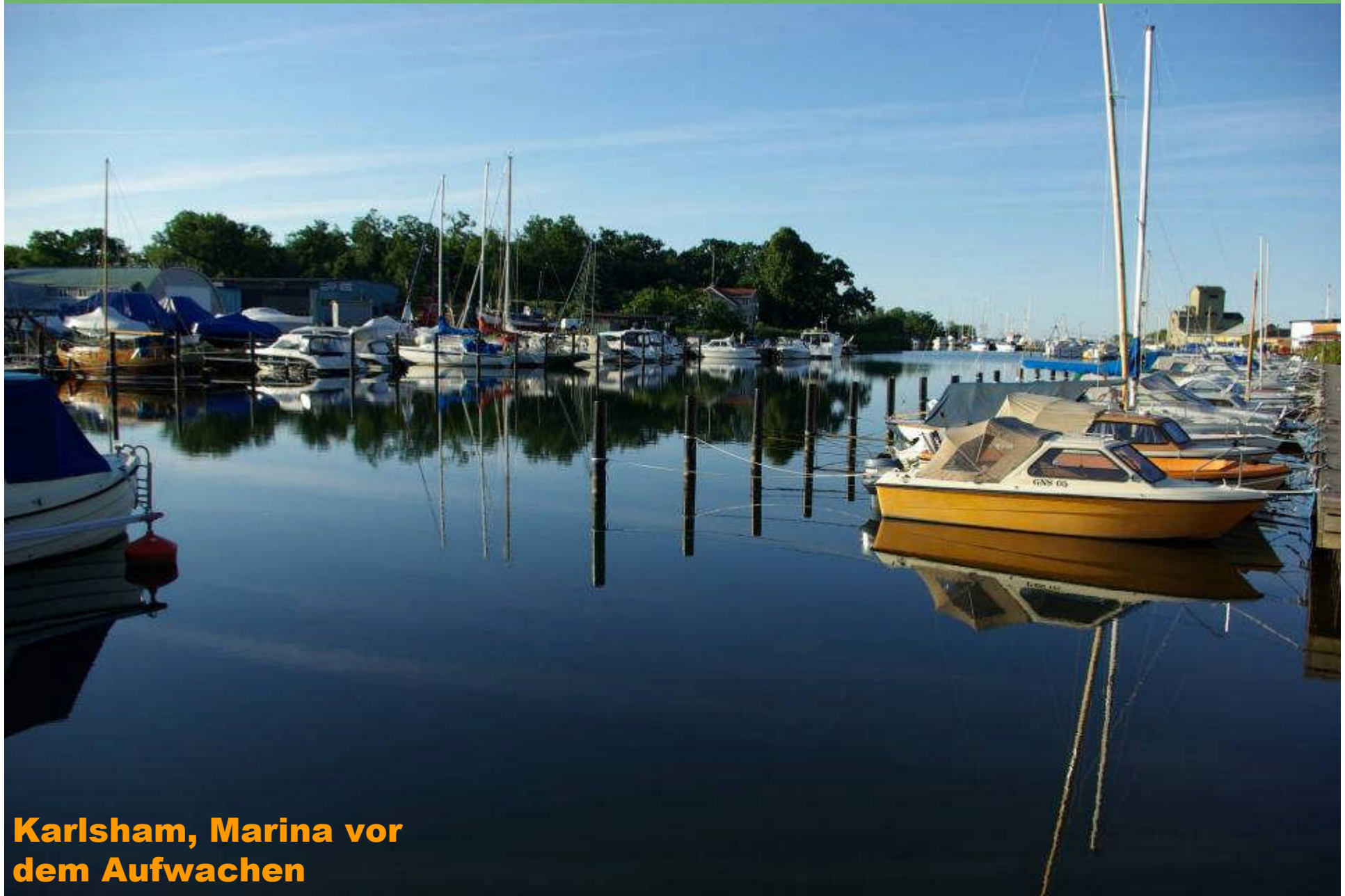
Karlsham, Marina vor dem Aufwachen