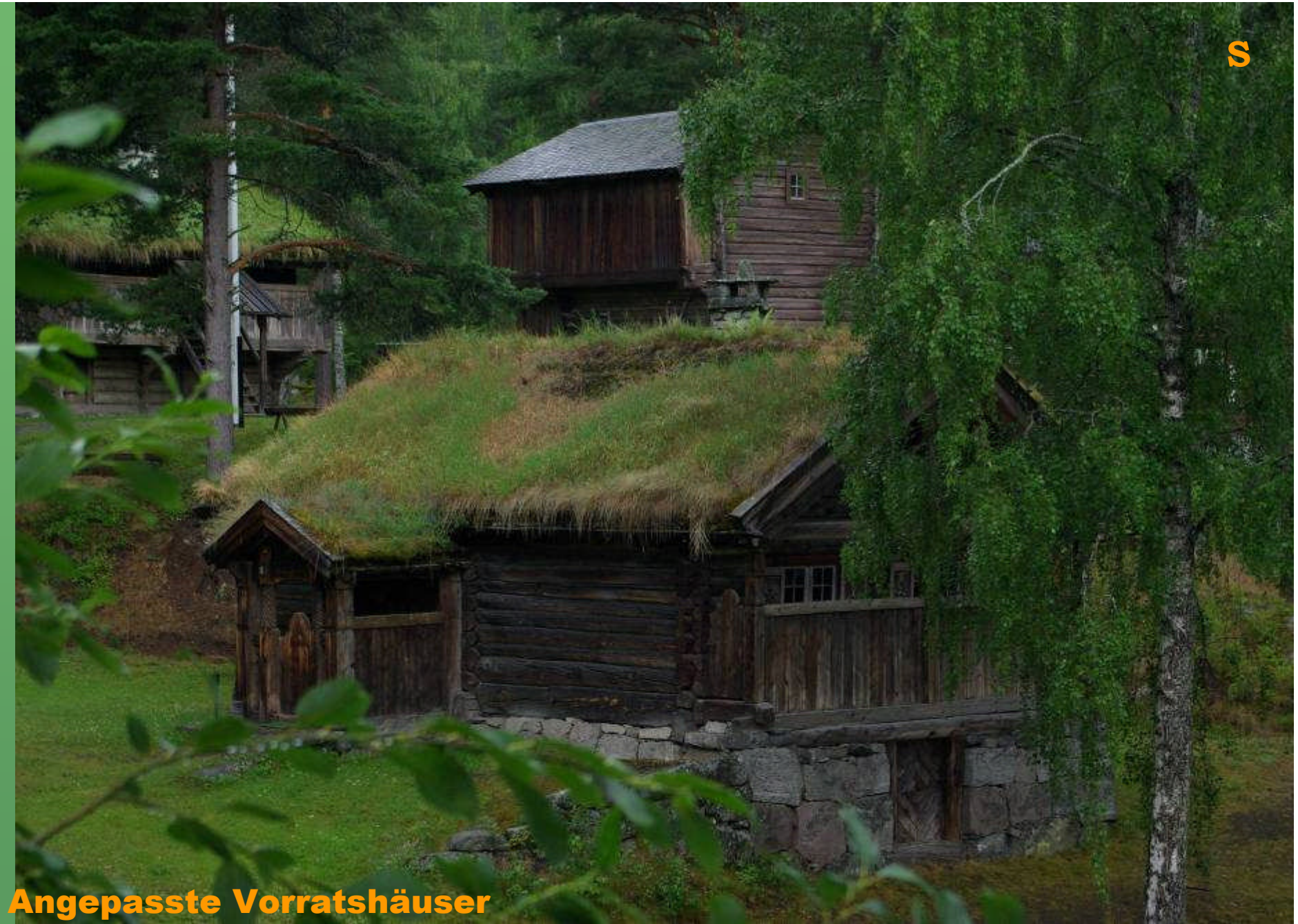
Angepasste Vorratshäuser auf dem Lande