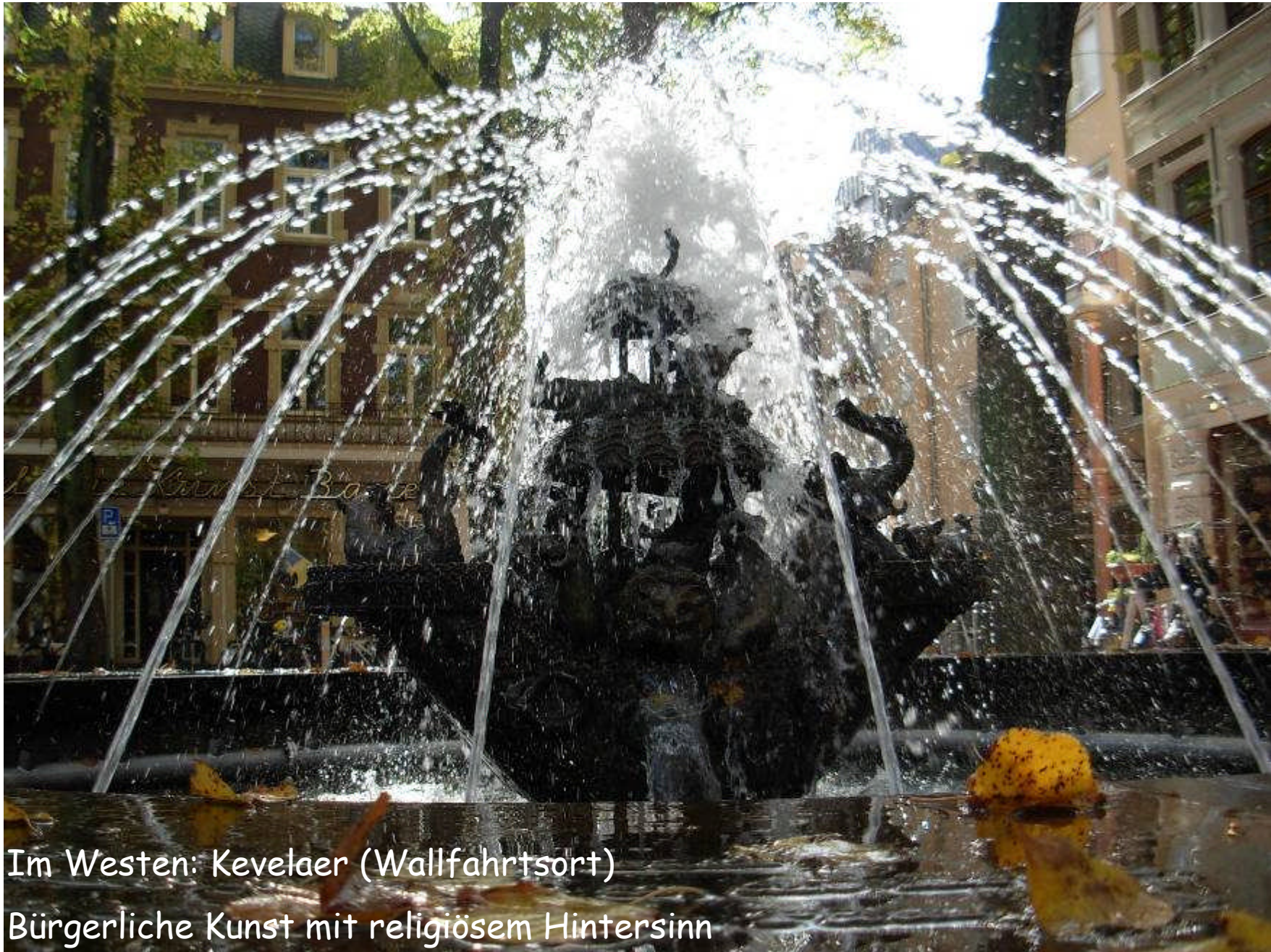
Im Westen: Kevelaer (Wallfahrtsort) Bürgerliche Kunst mit religiösem Hintersinn