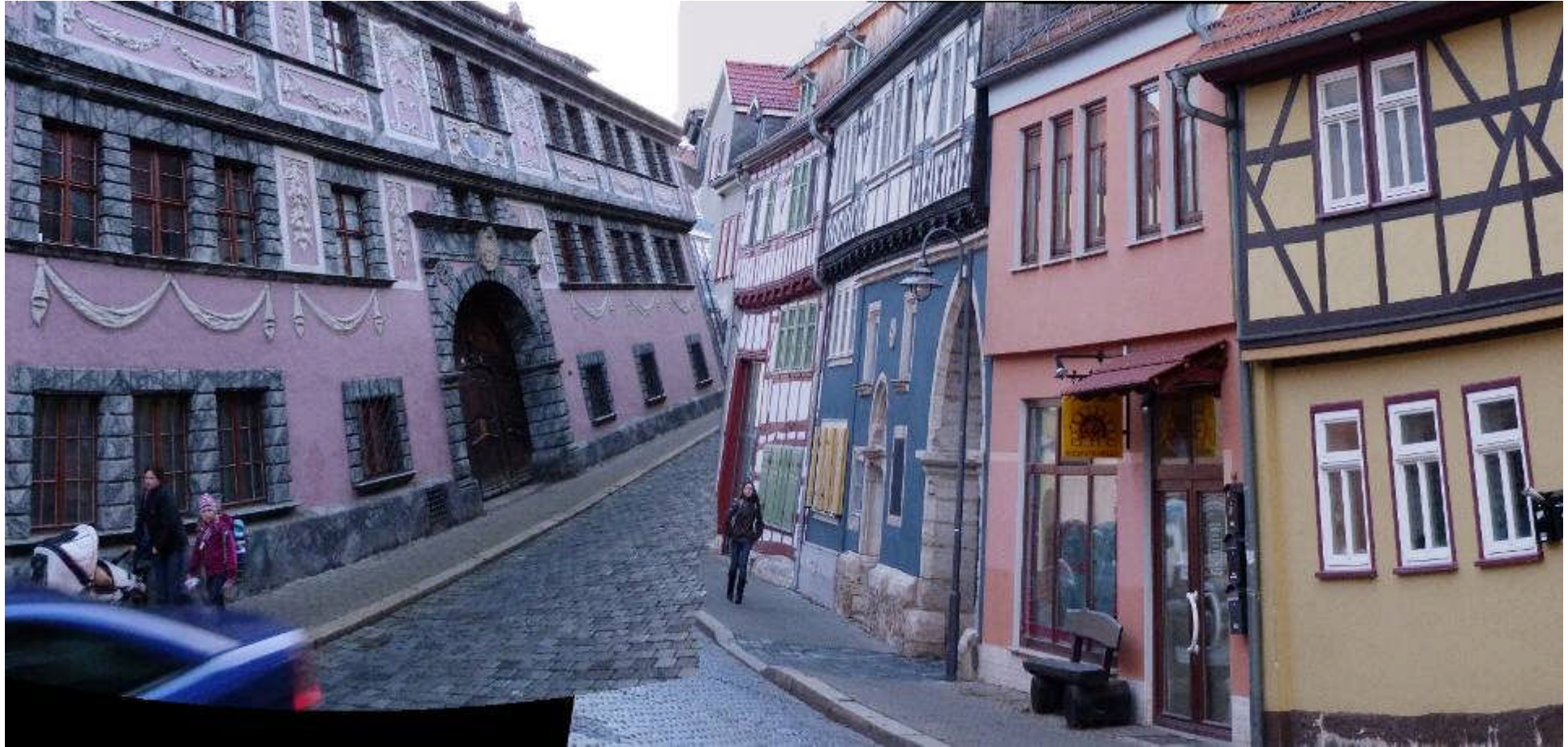
Im Osten: Bad Langensalza die restaurierte Altstadt