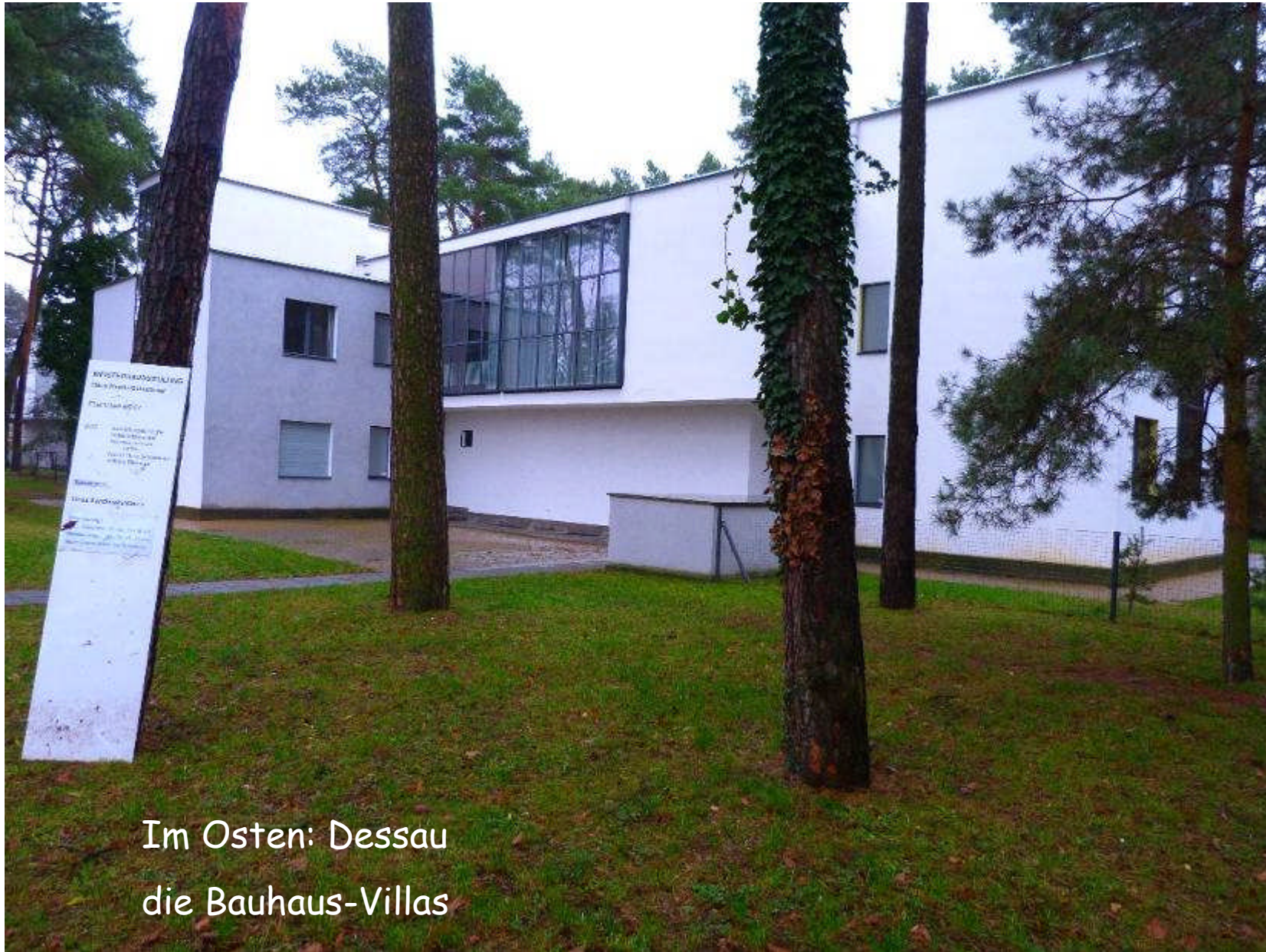
Im Osten: Dessau die Bauhaus-Villas