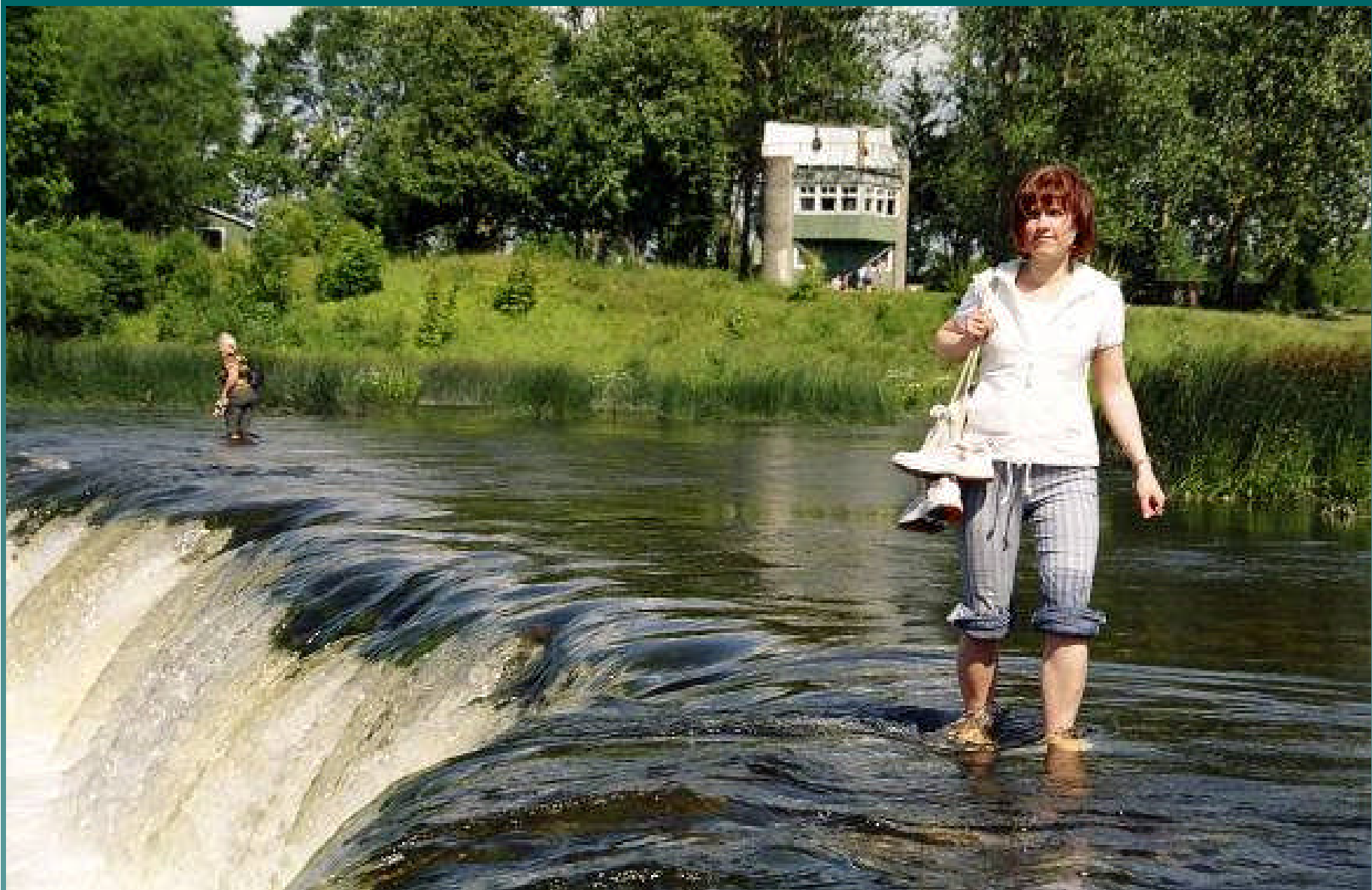
Venta-Wasserfall (Kurland) bei Kuldīga