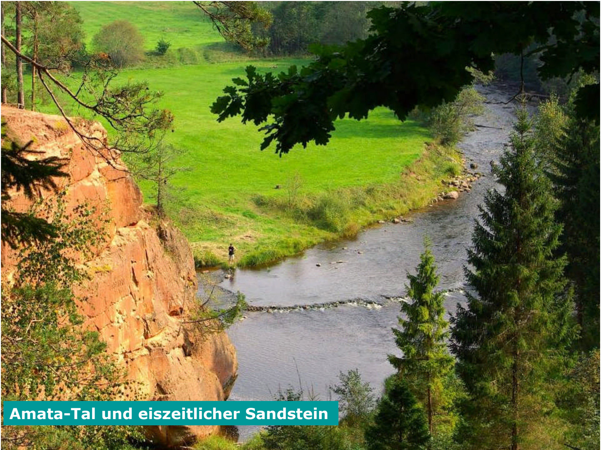
Amata-Tal und eiszeitlicher Sandstein