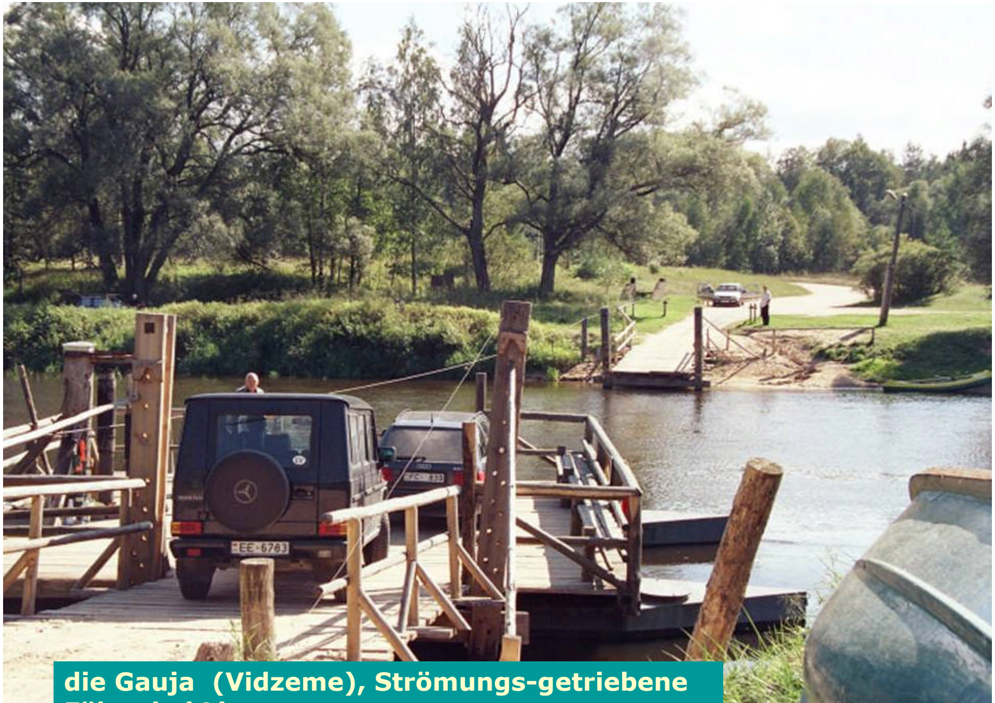
die Gauja (Vidzeme), Strömungs-getriebene Fähre bei Ligatne