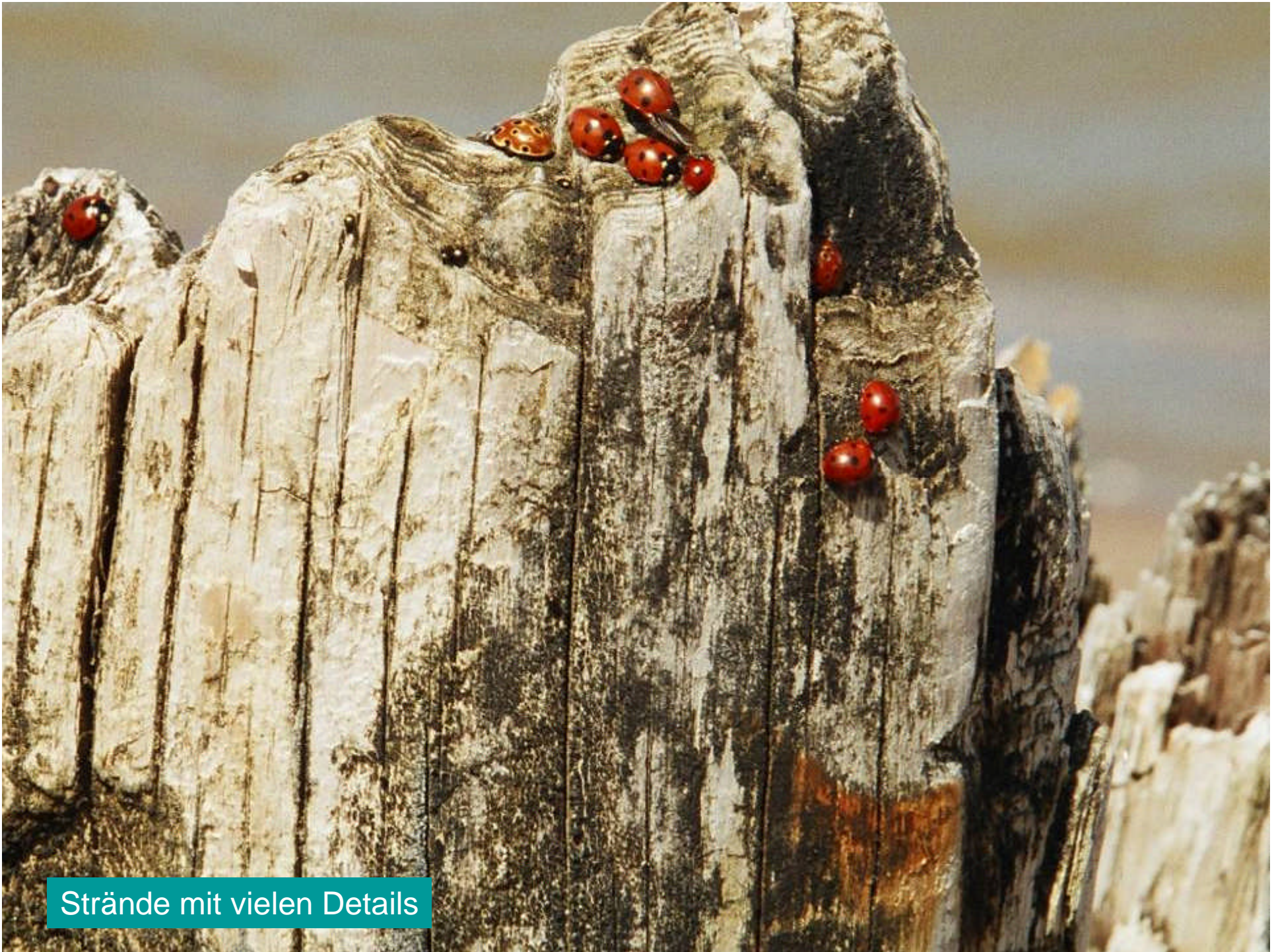
Strände mit vielen Details