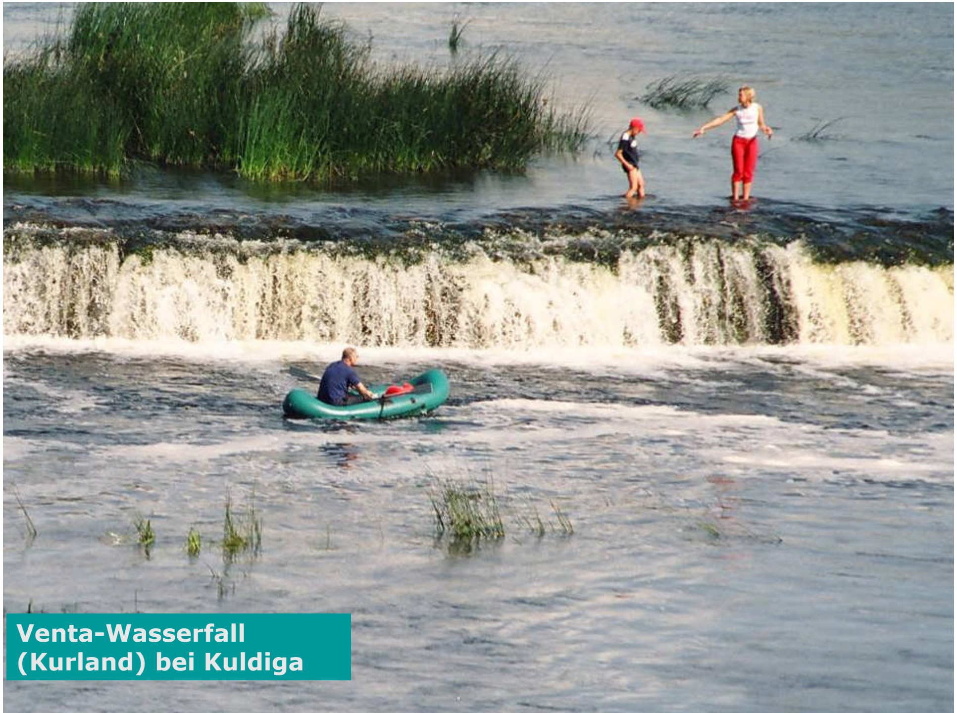
Venta-Wasserfall (Kurland) bei Kuldīga