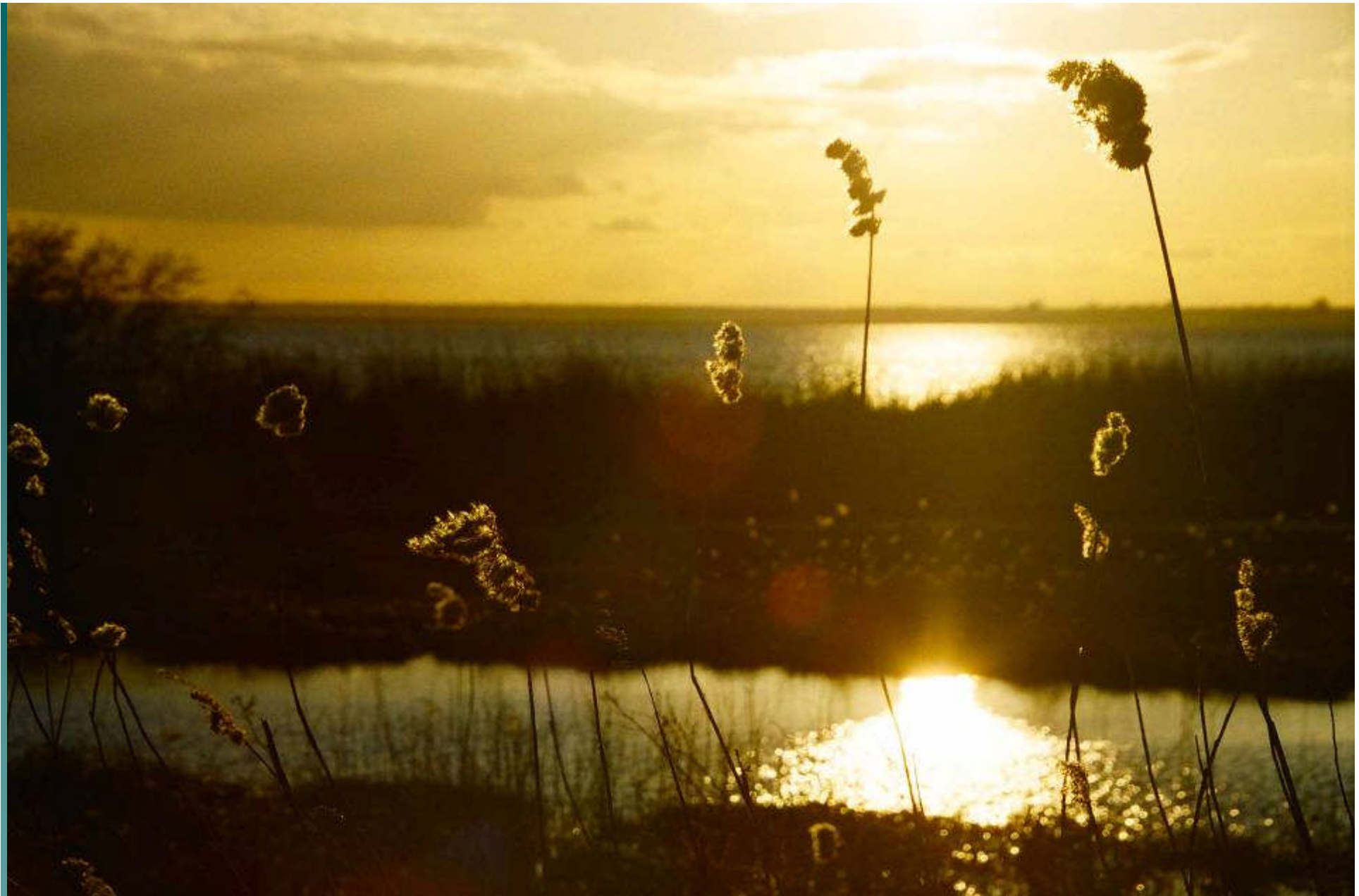
Lielupe, Auenlandschaft bei Jurmala