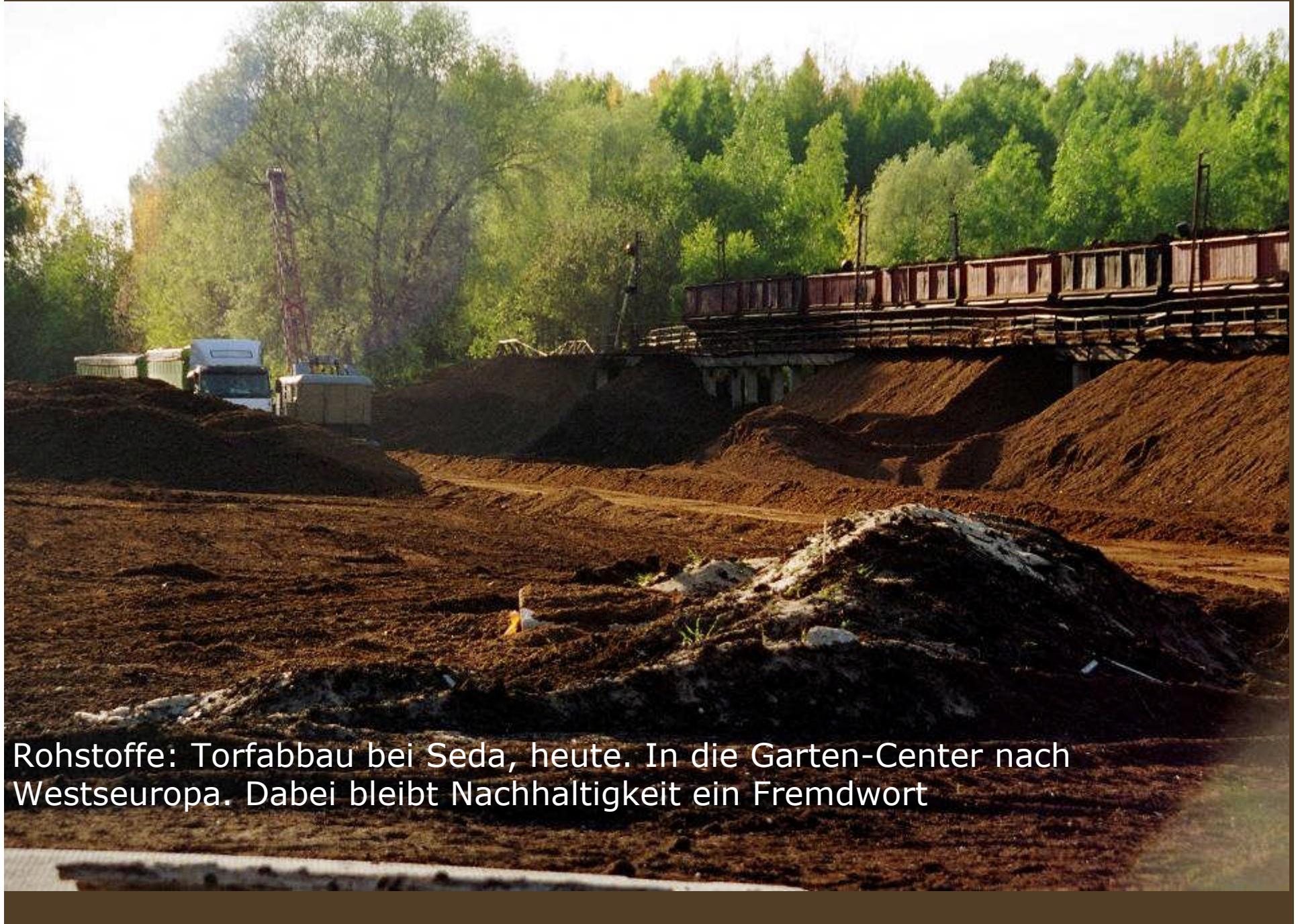
Rohstoffe: Torfabbau bei Seda, heute. In die Garten-Center nach Westseuropa. Dabei bleibt Nachhaltigkeit ein Fremdwort