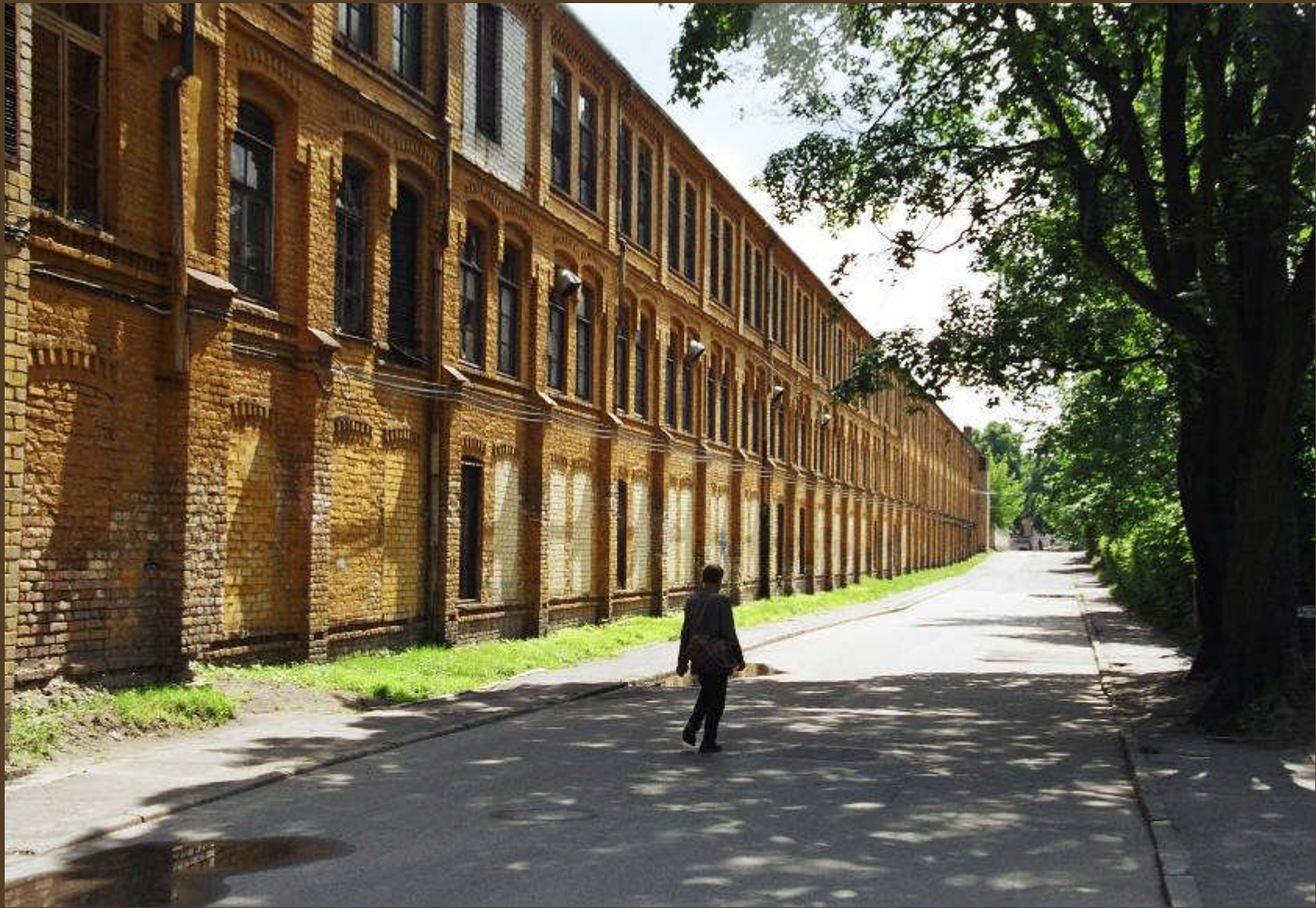
Fabrikanlagen stillgelegt, in Riga und im Lande