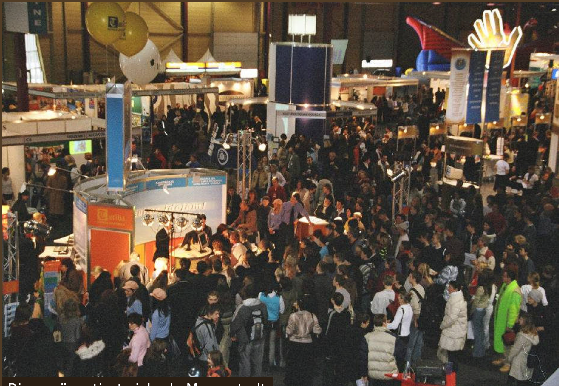
Riga präsentiert sich als Messestadt