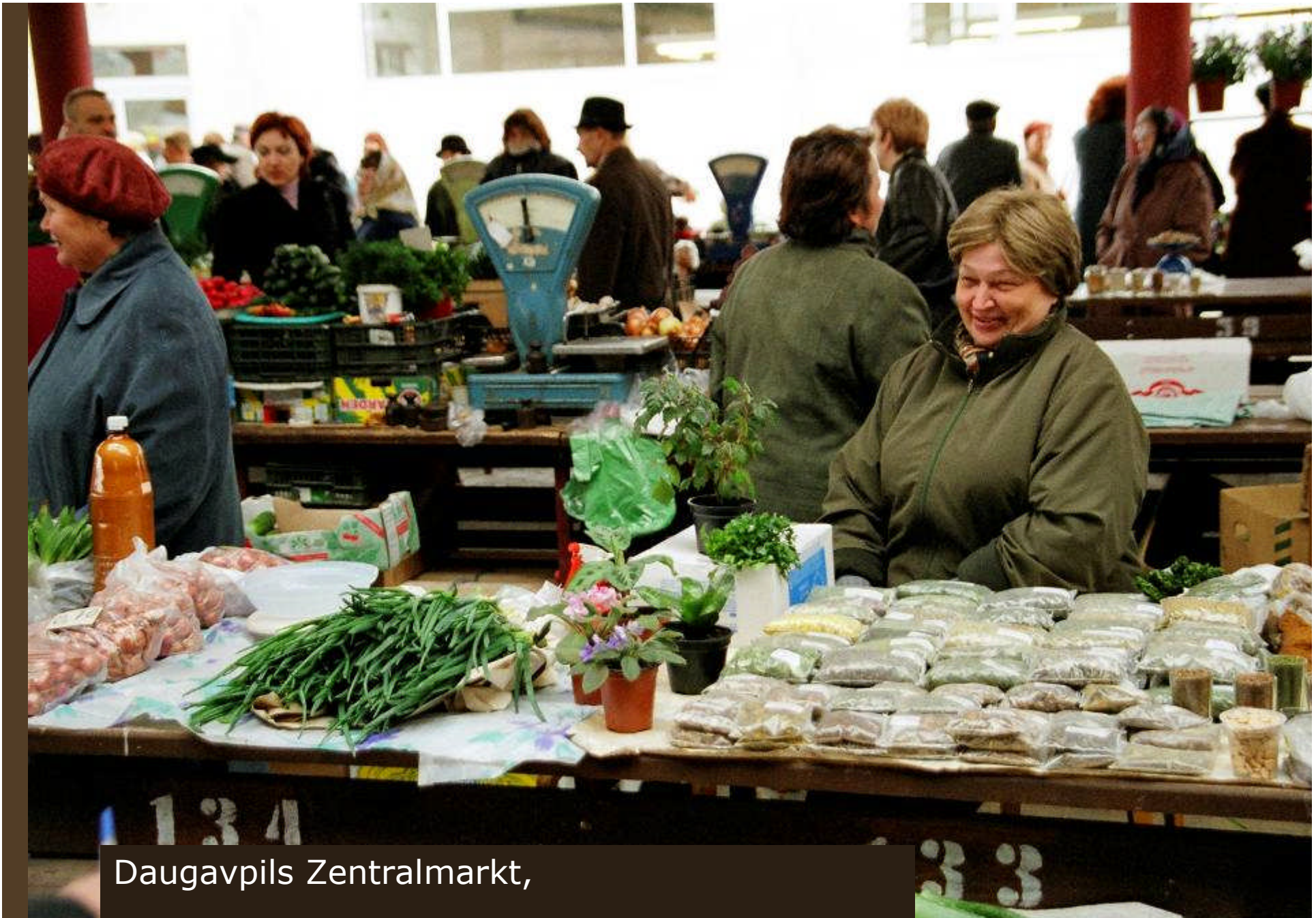
Daugavpils Zentralmarkt, Letten sind hier die kleine ethnische Minderheit