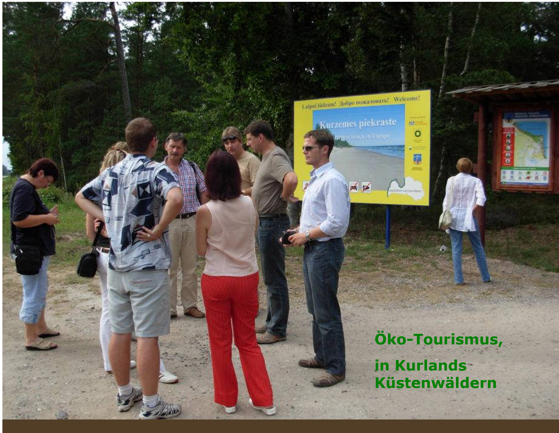
Öko-Tourismus, in Kurlands Küstenwäldern