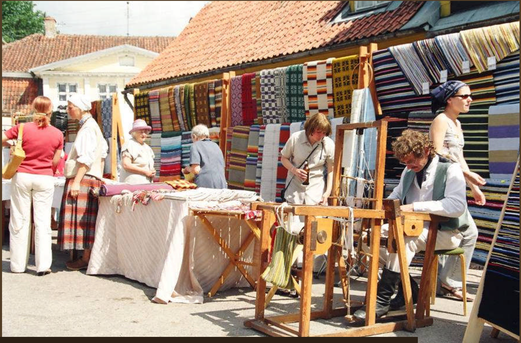
Reste des früher starken Textilsektors (besonders Leinen), in Kuldiga