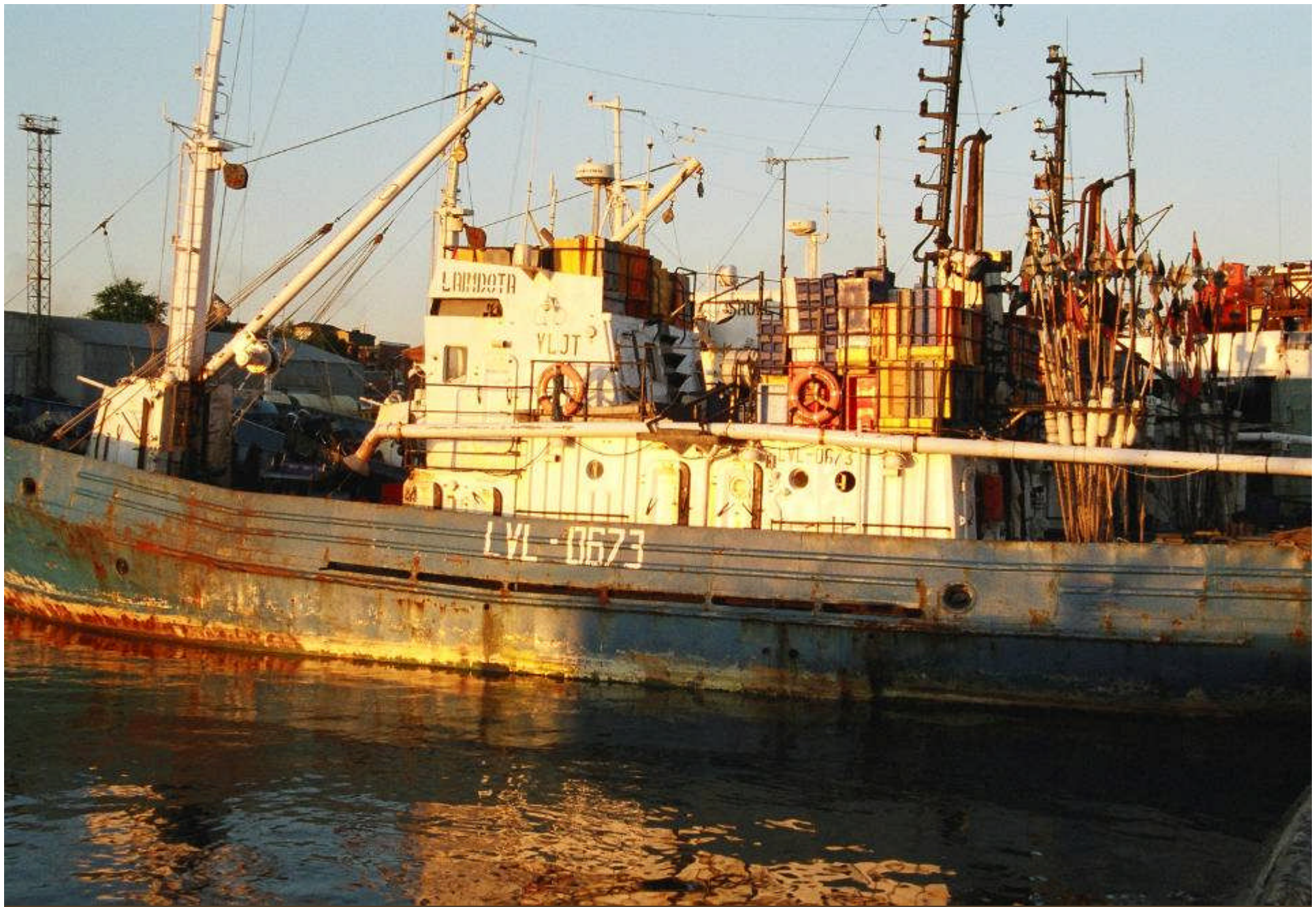
Fischfanflotte, im Hafen von Liepaja