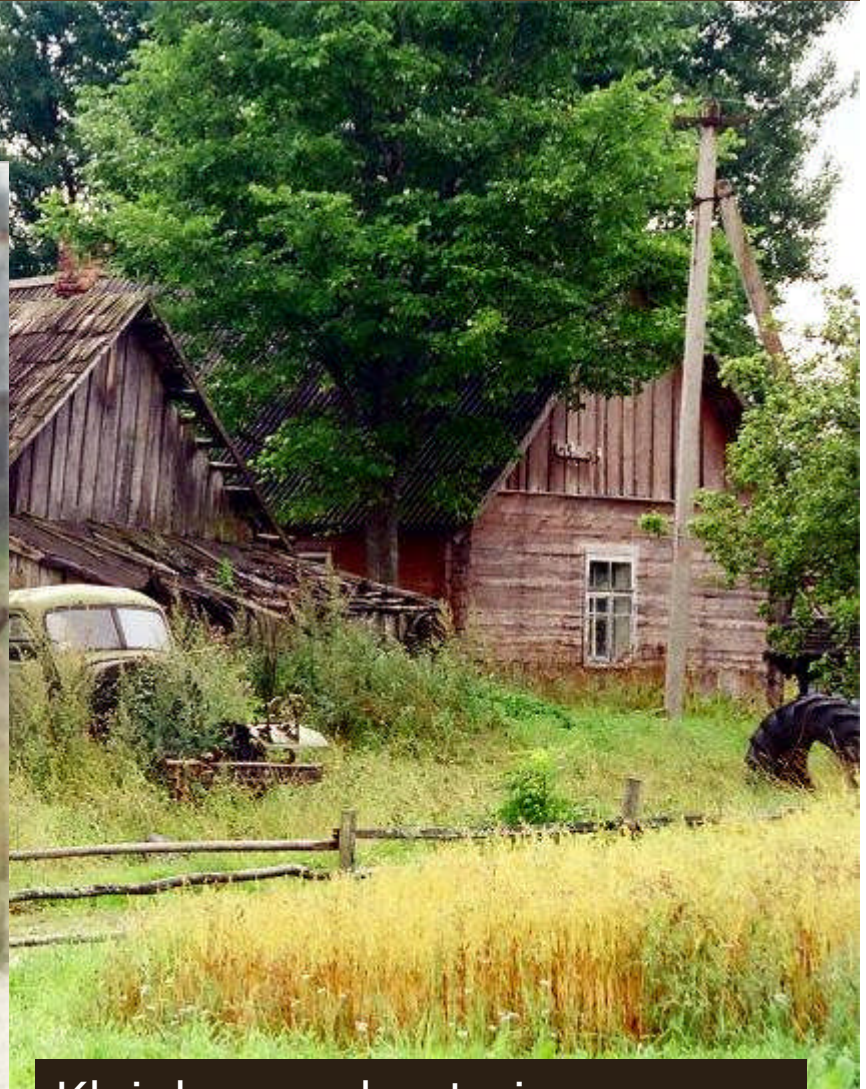
Kleinbauern heute in Ost-Lettland (Latgalen)