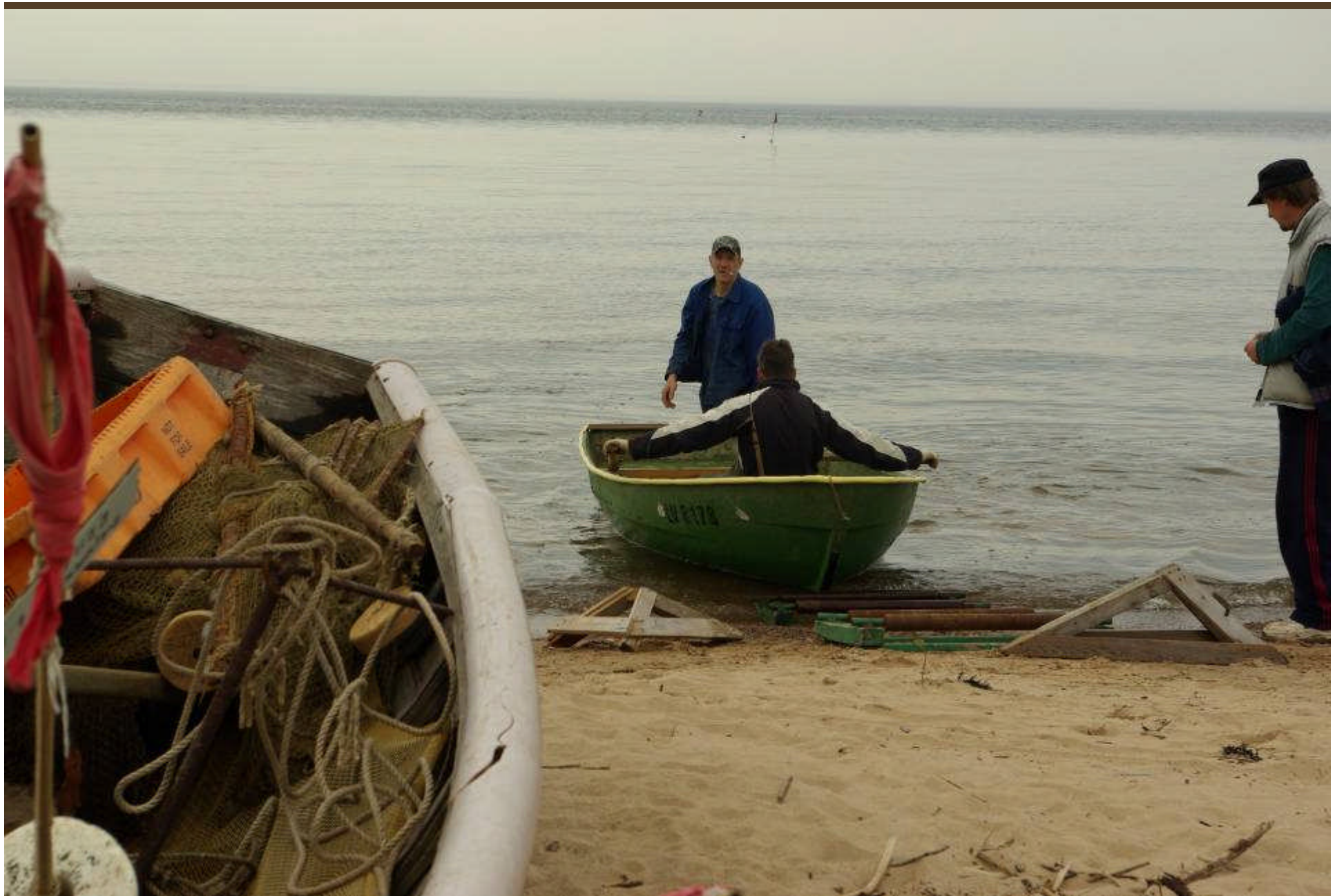
Traditionelle Selbstversorger an der Ostseeküste von Vidzeme