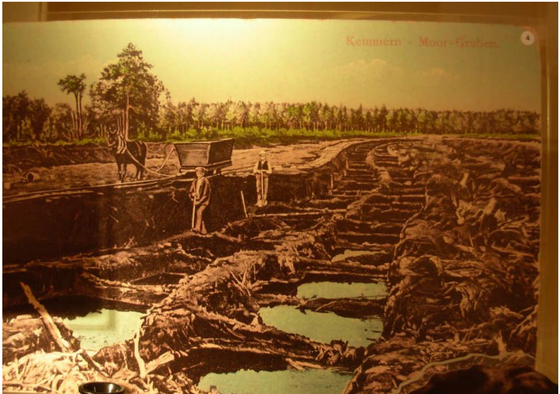
Kemmern - Moor-Gruben.