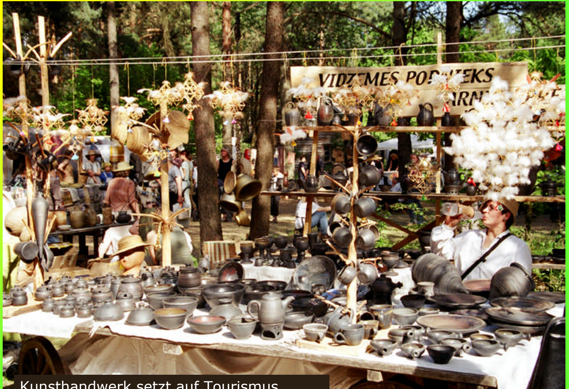
Kunsth Handwerk setzt auf Tourismus