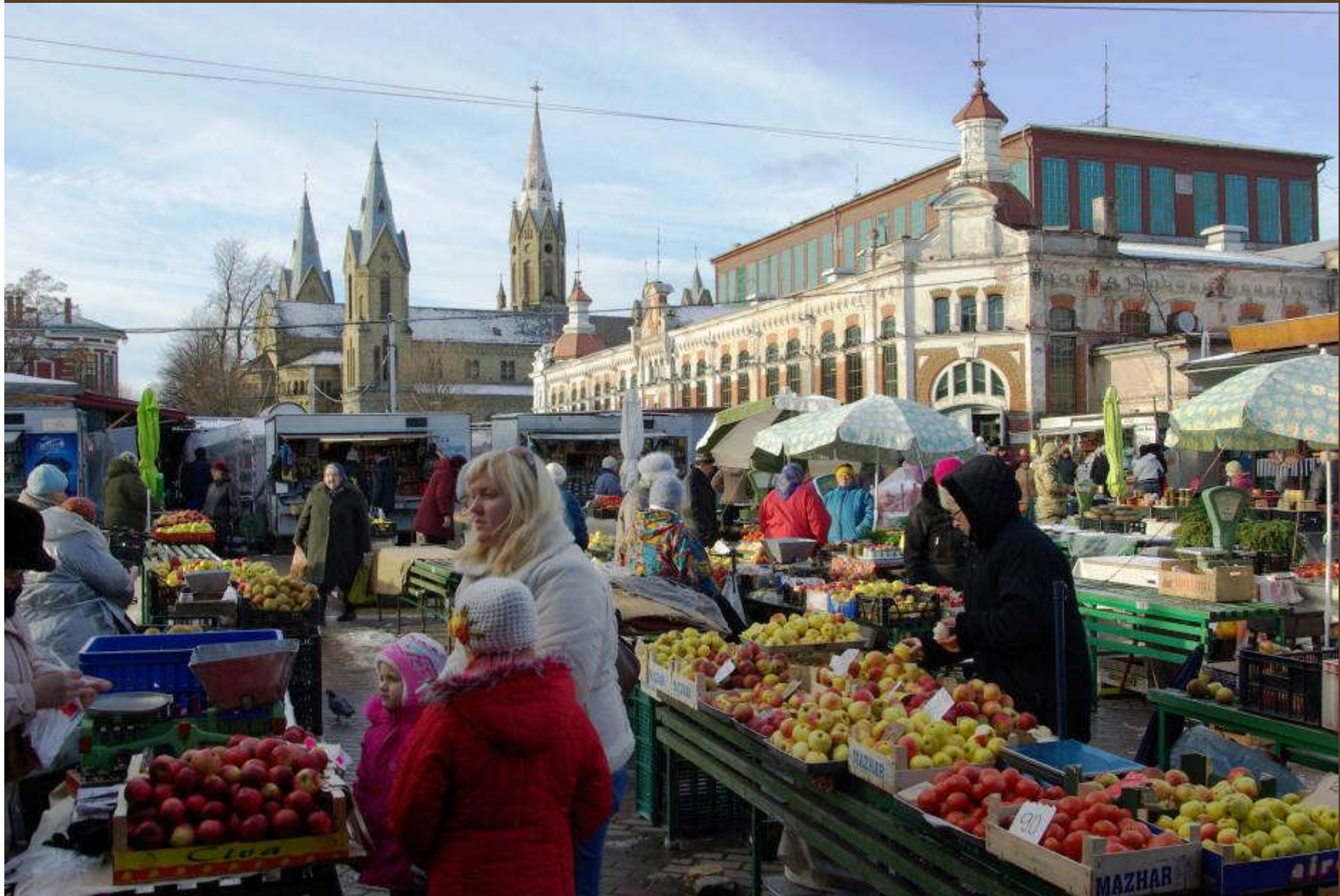
Liepaja, Zentralmarkt mit regionalen Produkten im Schatten der Bischofskirche