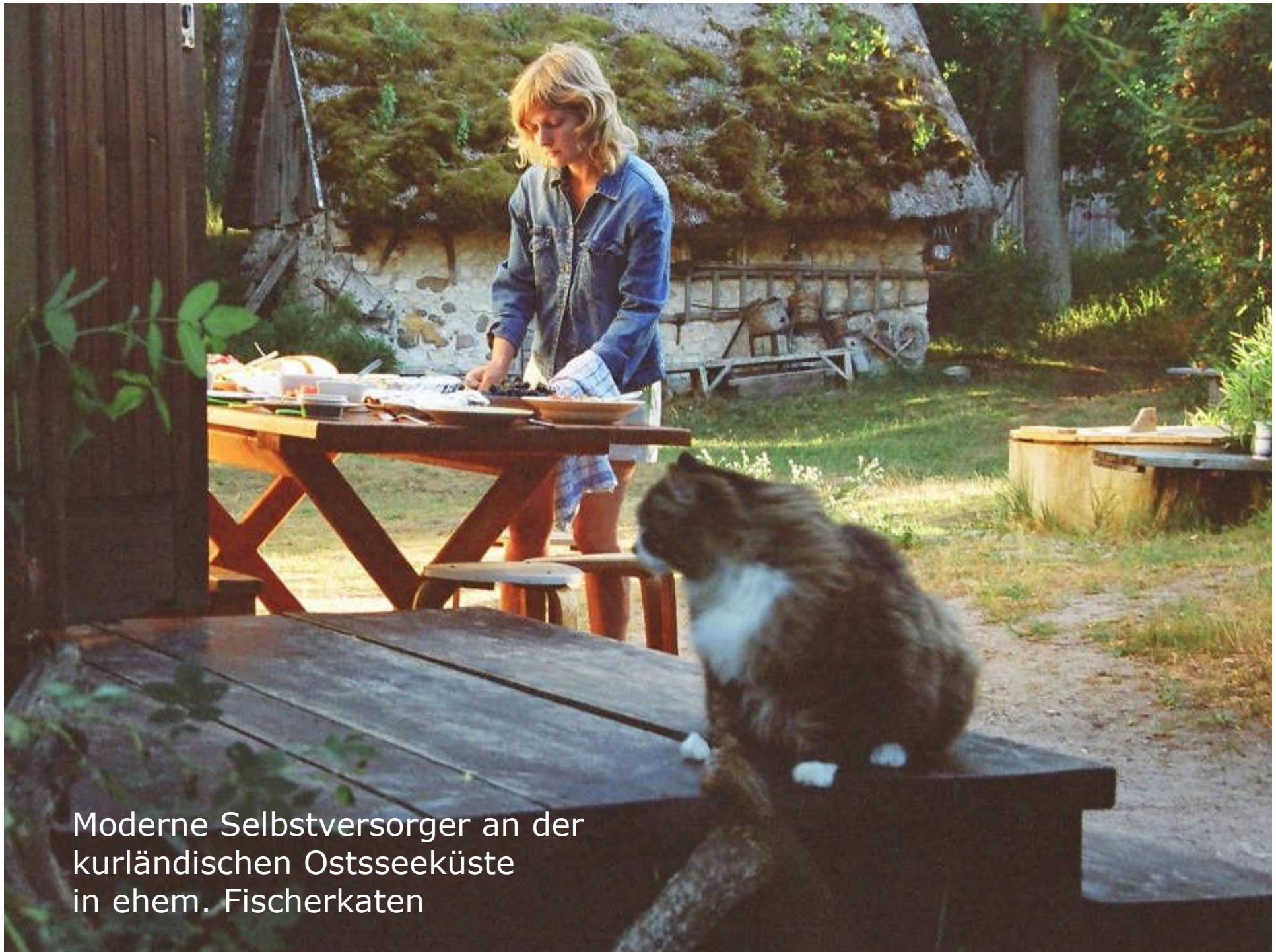
Moderne Selbstversorger an der kurländischen Ostseeküste in ehem. Fischerkaten