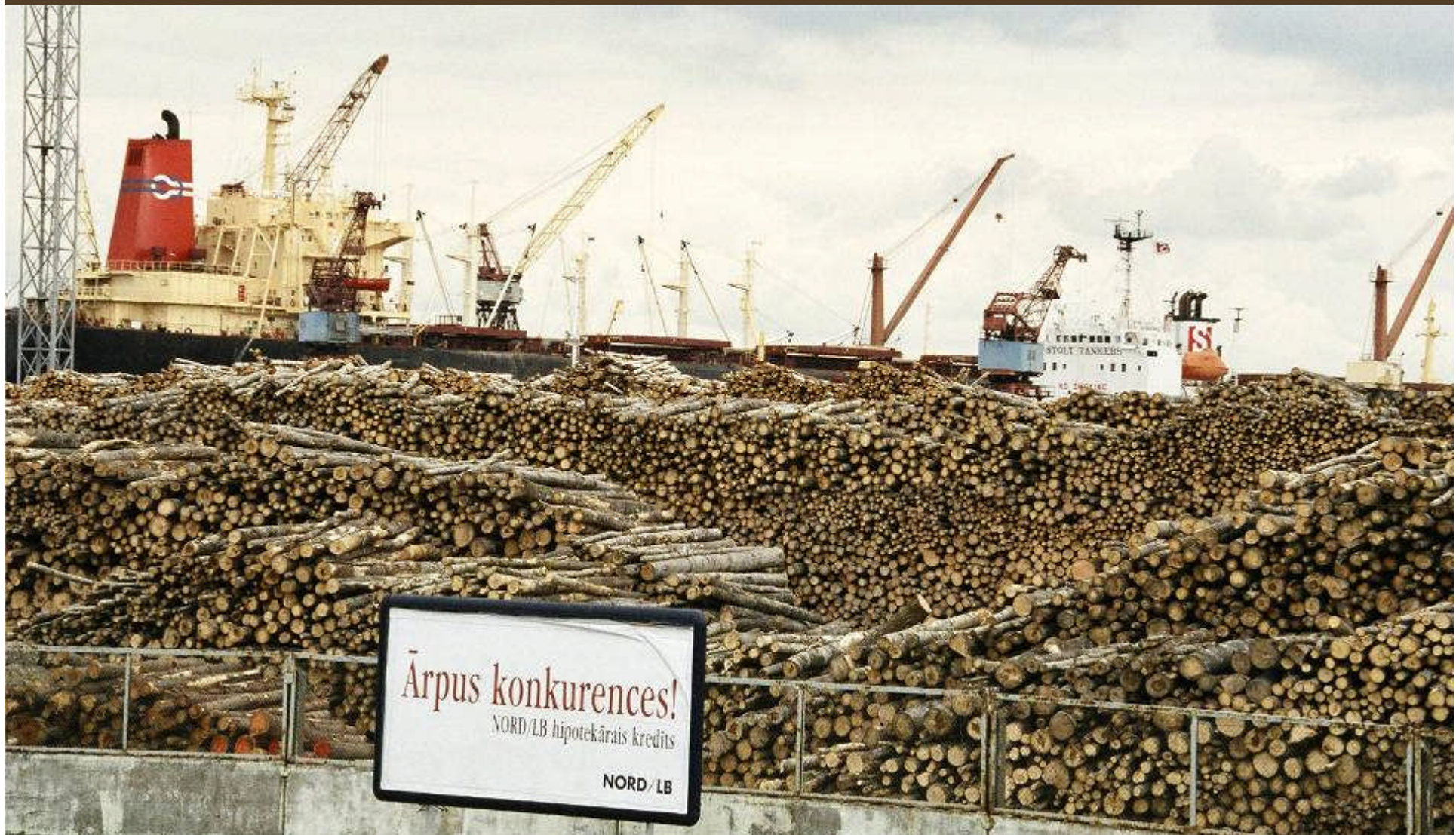
Rohstoffe: Holz-Export ohne Mehrwertschöpfung im Lande, im Rigaer Hafen