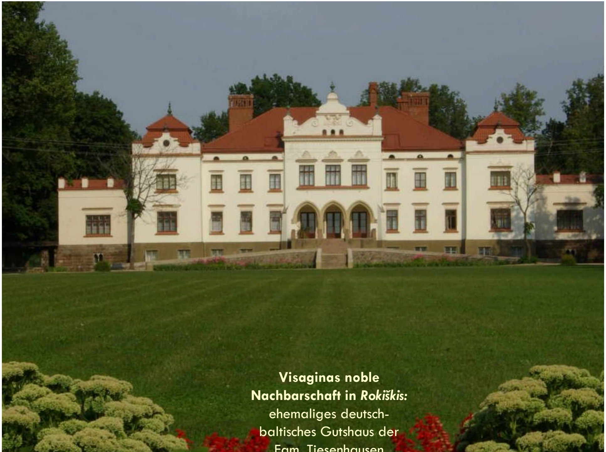
Visaginas noble Nachbarschaft in Rokiškis : ehemaliges deutsch- baltisches Gutshaus der Fam. Tiesenhausen