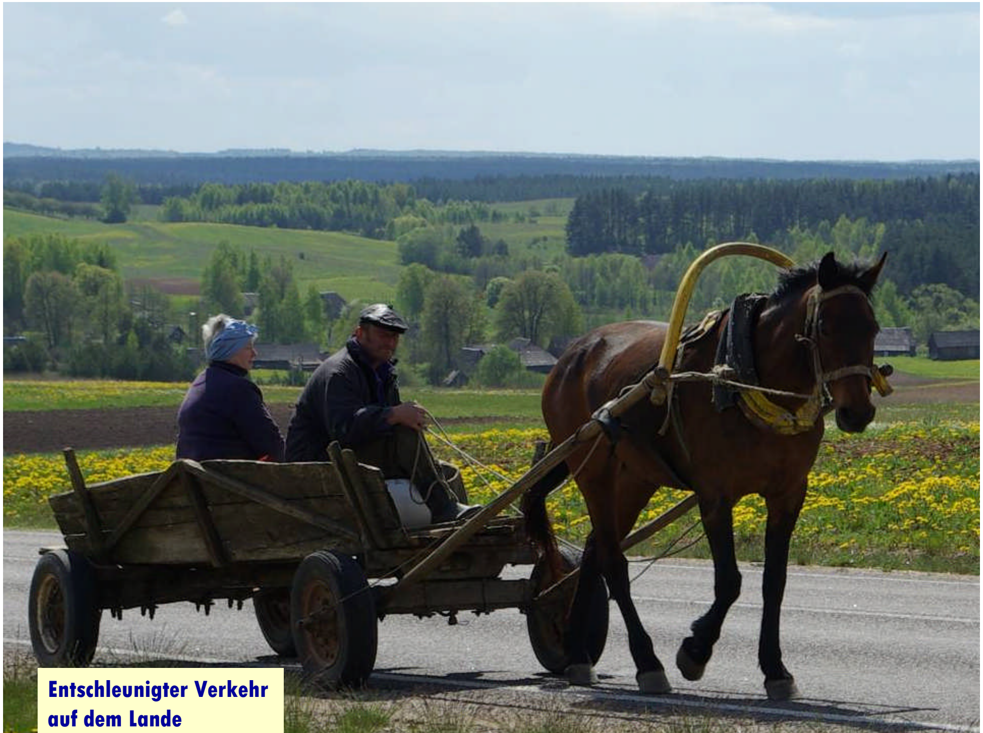
Entschleunigter Verkehr auf dem Lande