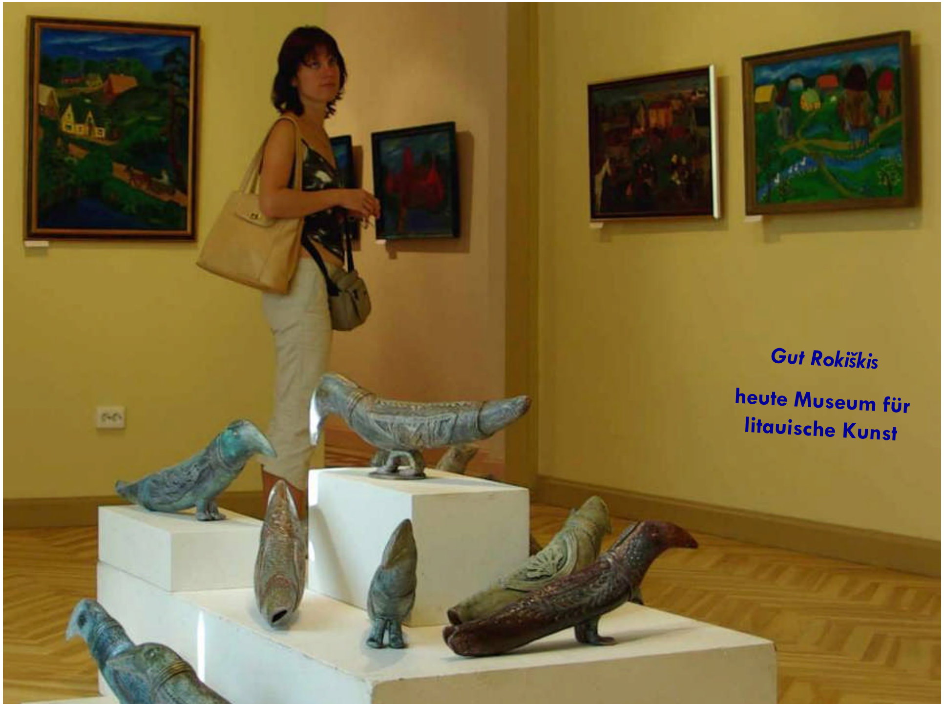
Gut Rokiskis heute Museum für litauische Kunst