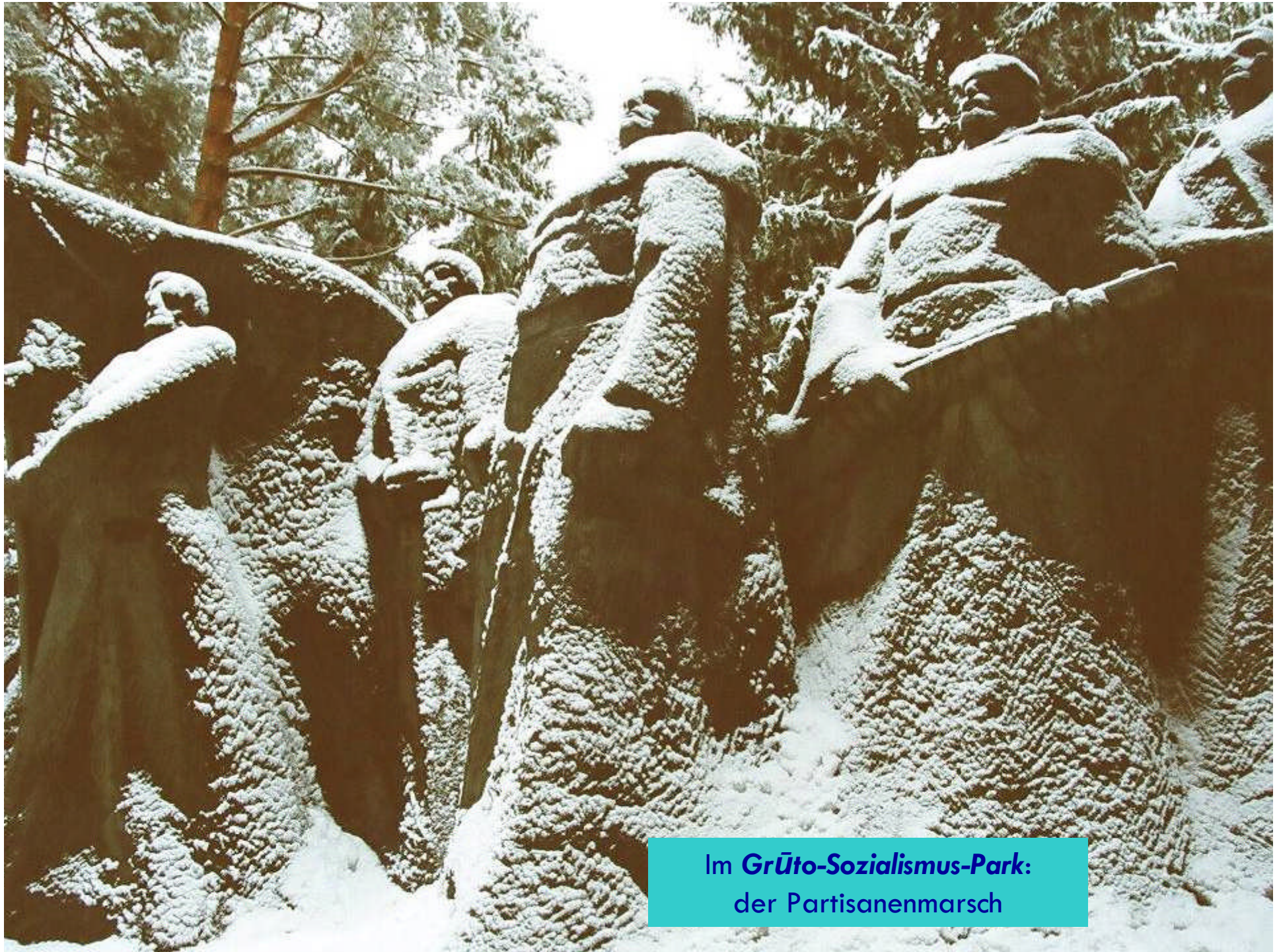
Im Grüto-Sozialismus-Park : der Partisanenmarsch