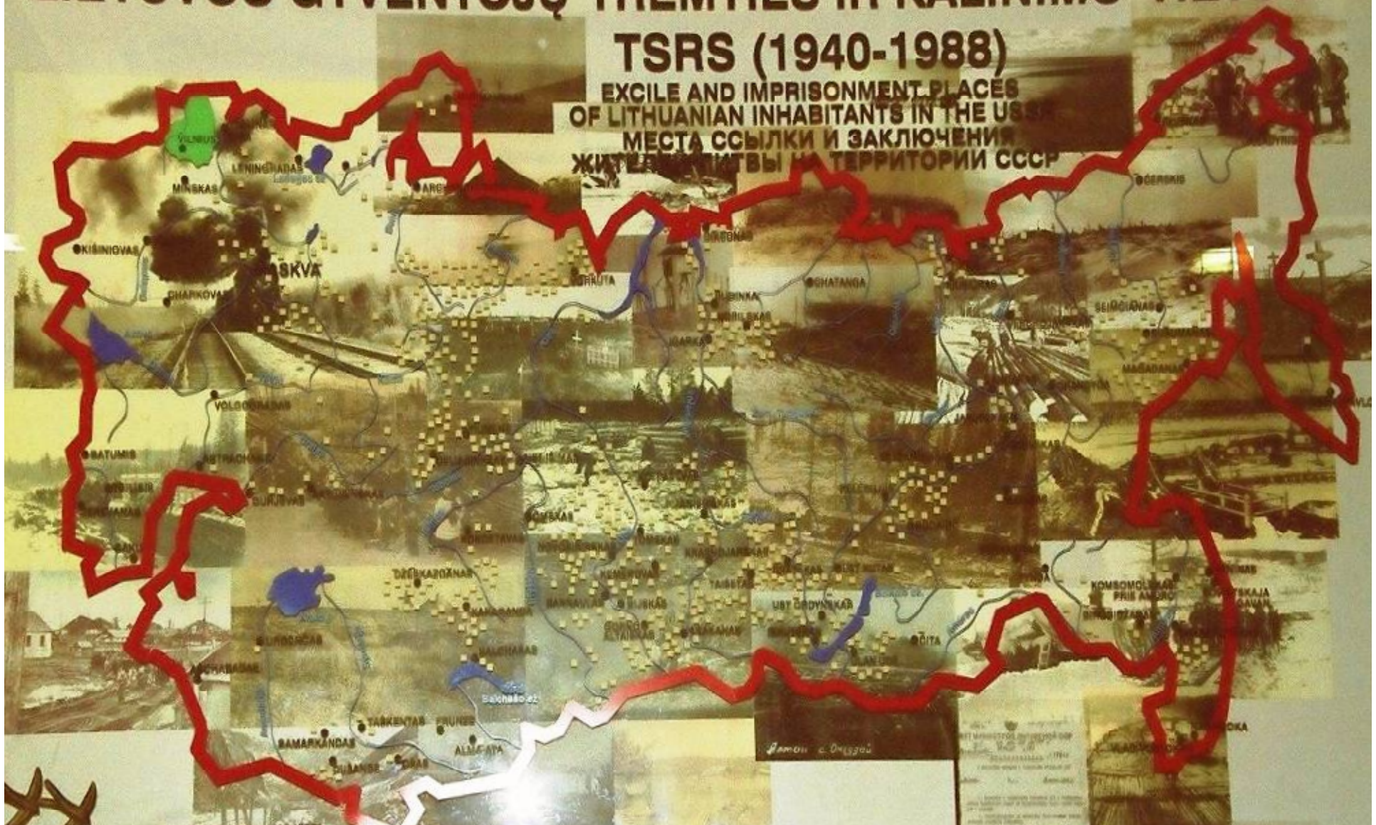
Politische Bildung im Grüto: die Lager-Karte während Litauens Besetzung 1940-1988

EXCILE AND IMPRISONMENT PLACES OF LITHUANIAN INHABITANTS IN THE USSR МЕСТА ССЫЛКИ И ЗАКЛЮЧЕНИЯ ЖИТЕЛЕЙ ЛИТОВЫ НА ТЕРРИТОРИИ СССР