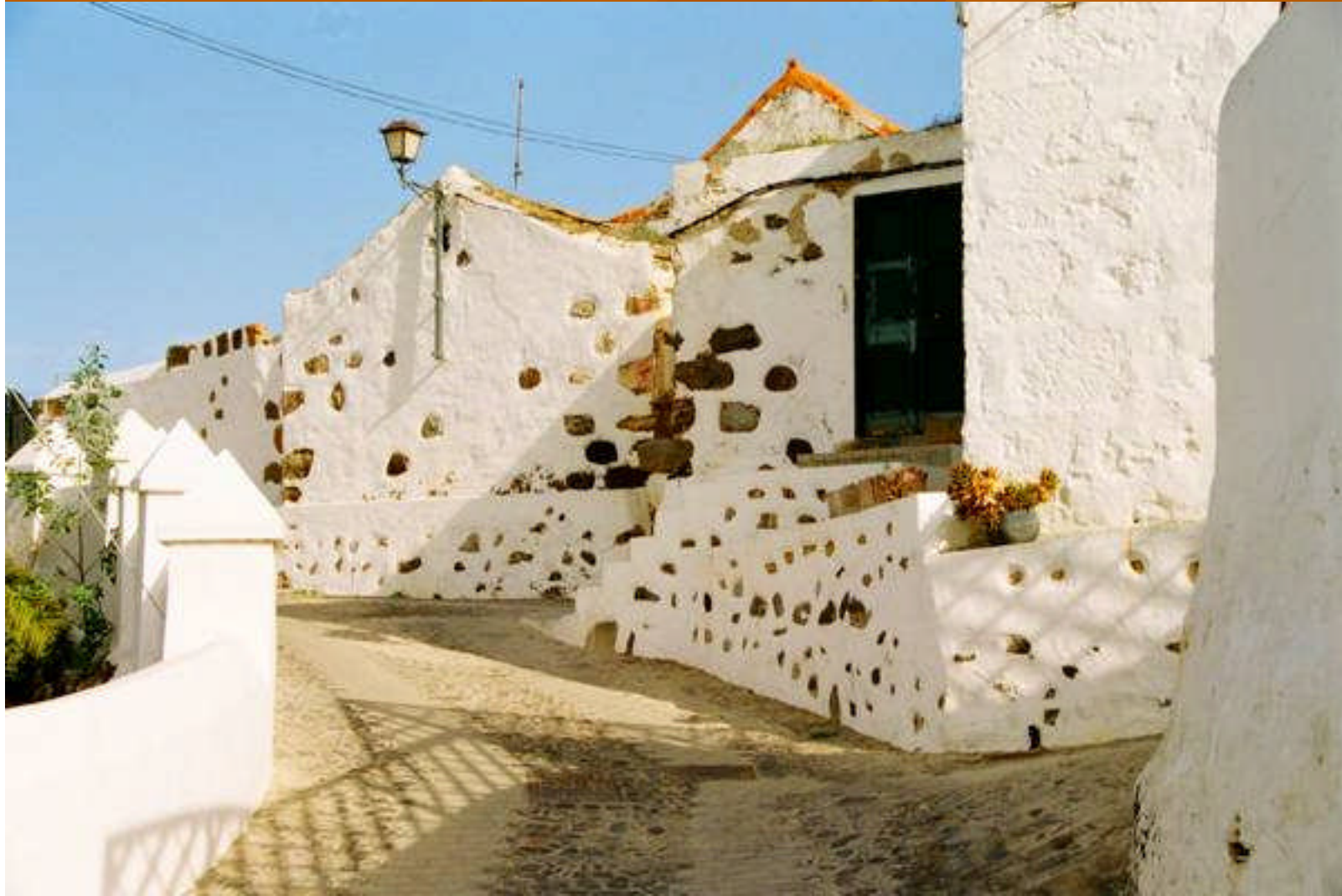
Hausecken mit natürlichem Steinschmuck