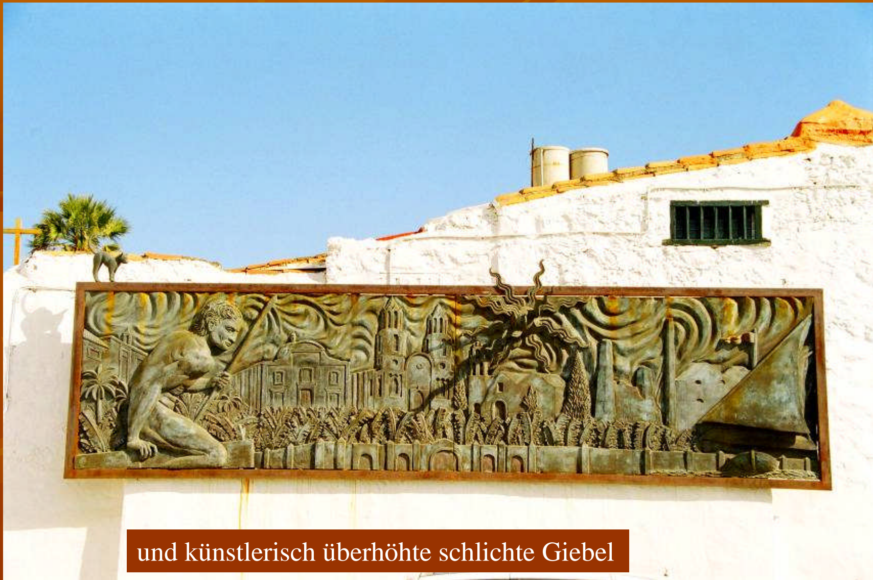
und künstlerisch überhöhte schlichte Giebel