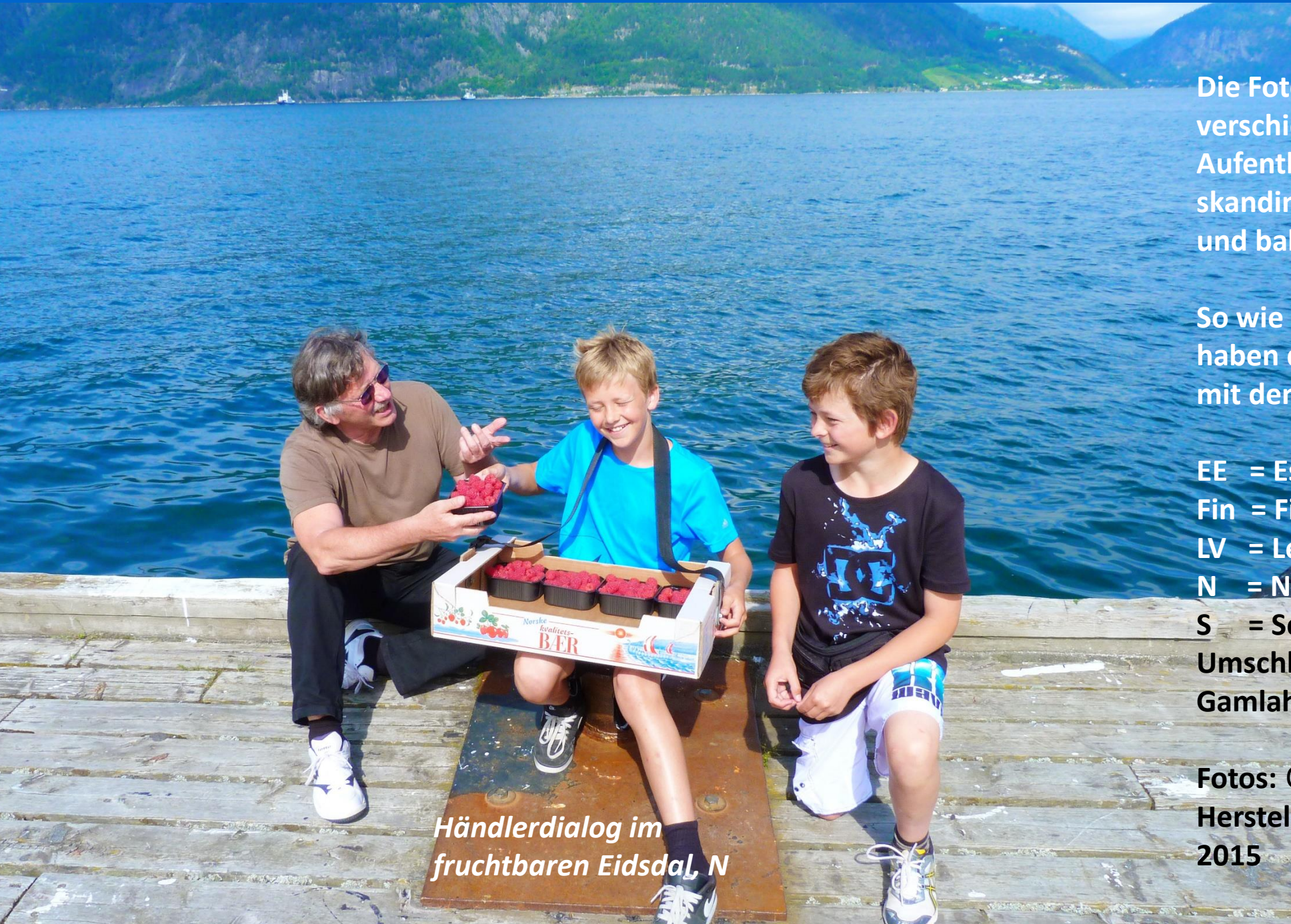
Händlerdialog im fruchtbaren Eidsdal, N

Die Fotos stammen von verschiedenen Aufenthalten in den skandinavischen und baltischen Ostseeländern.