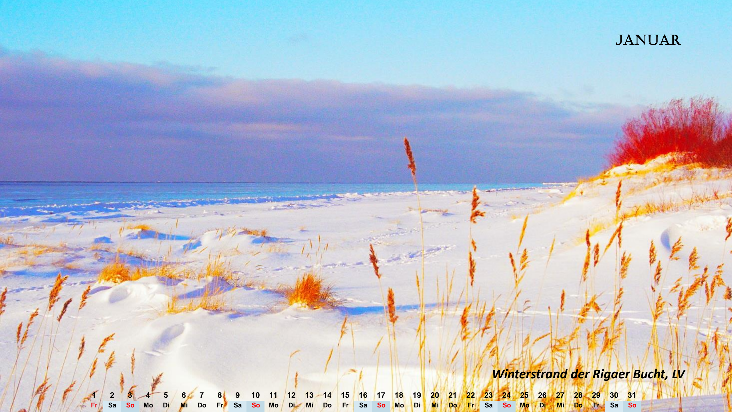
Winterstrand der Rigaer Bucht, LV