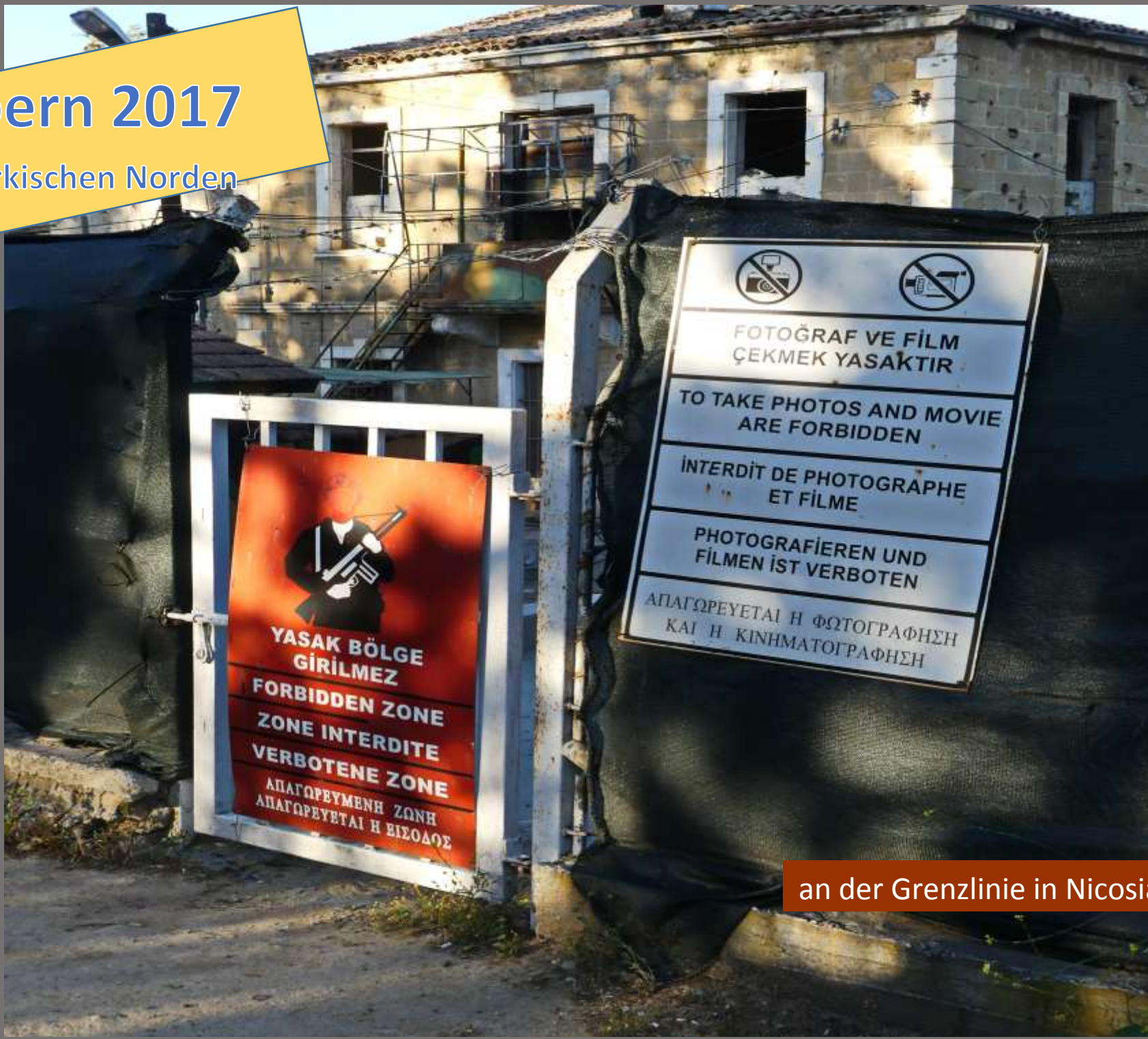
an der Grenzlinie in Nicosia