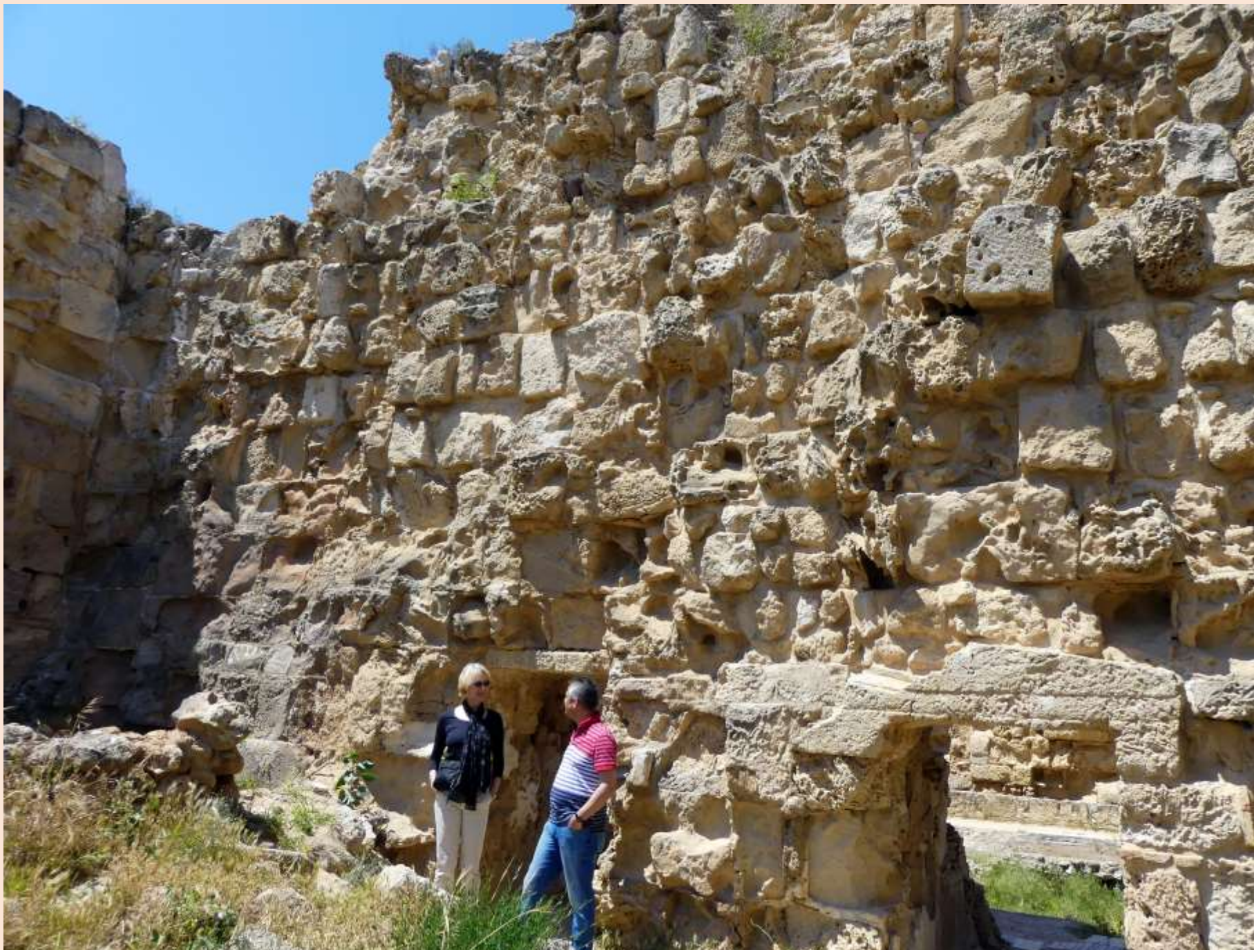
im römischen Amphit- Theater bei Salamis