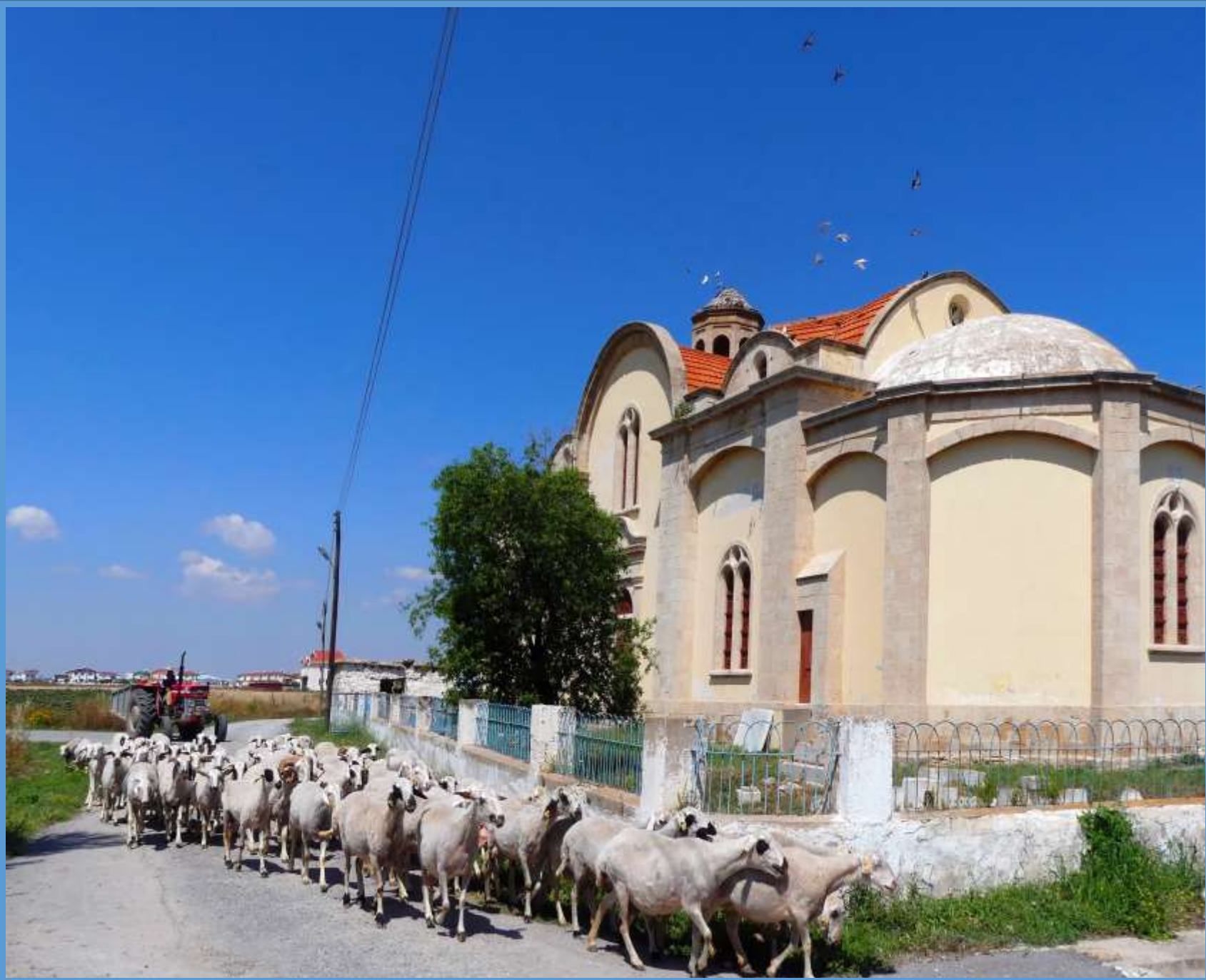
zerstörte christliche Kirche bei Salamis